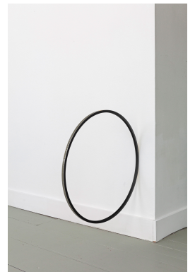
Der Künstler als Kreis (2017)